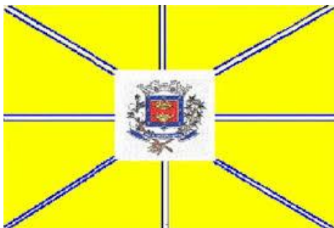
Bandeira do município de Conchal