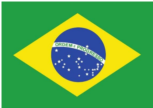
Bandeira do Brasil